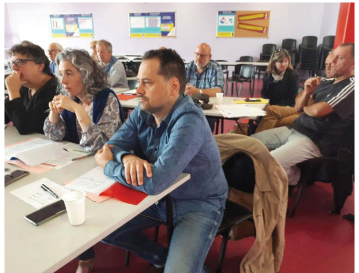
Le métier s'est complexifié et judiciarisé, une formation à la hauteur devrait être dispensée.