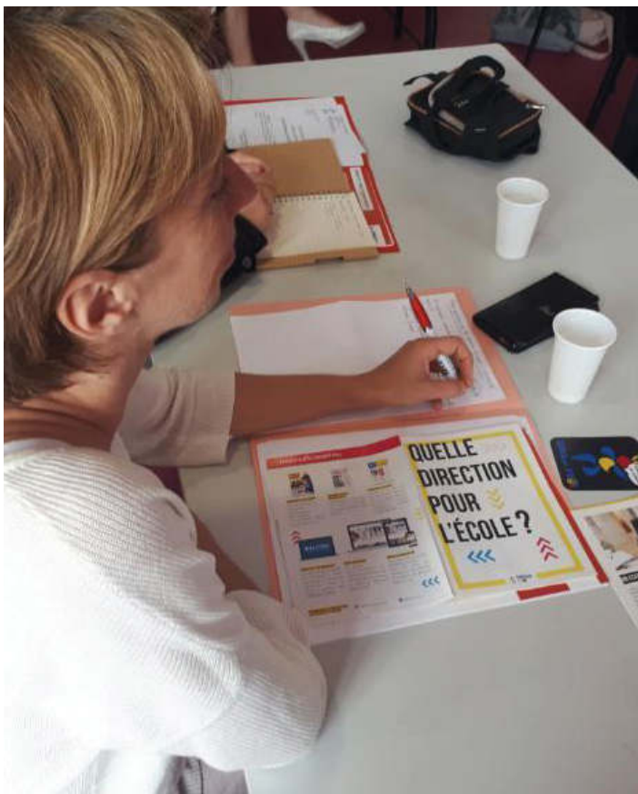
Dans les situations de conflit notamment avec des parents, la direction se sent souvent peu soutenue par sa hiérarchie.